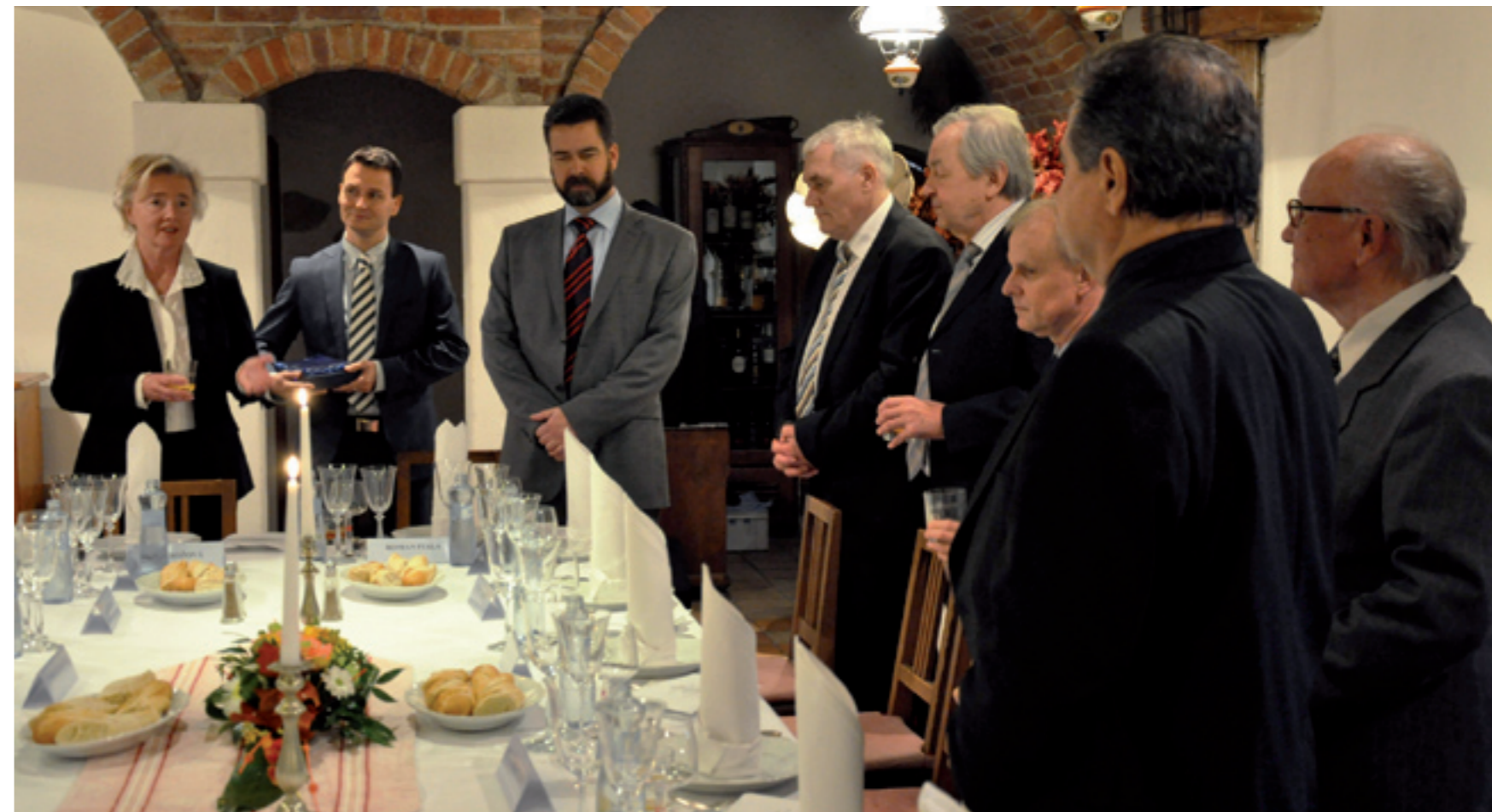
Setkání se soudci zakladateli novodo- bého Nejvyššího soudu, 12. 11. 2013