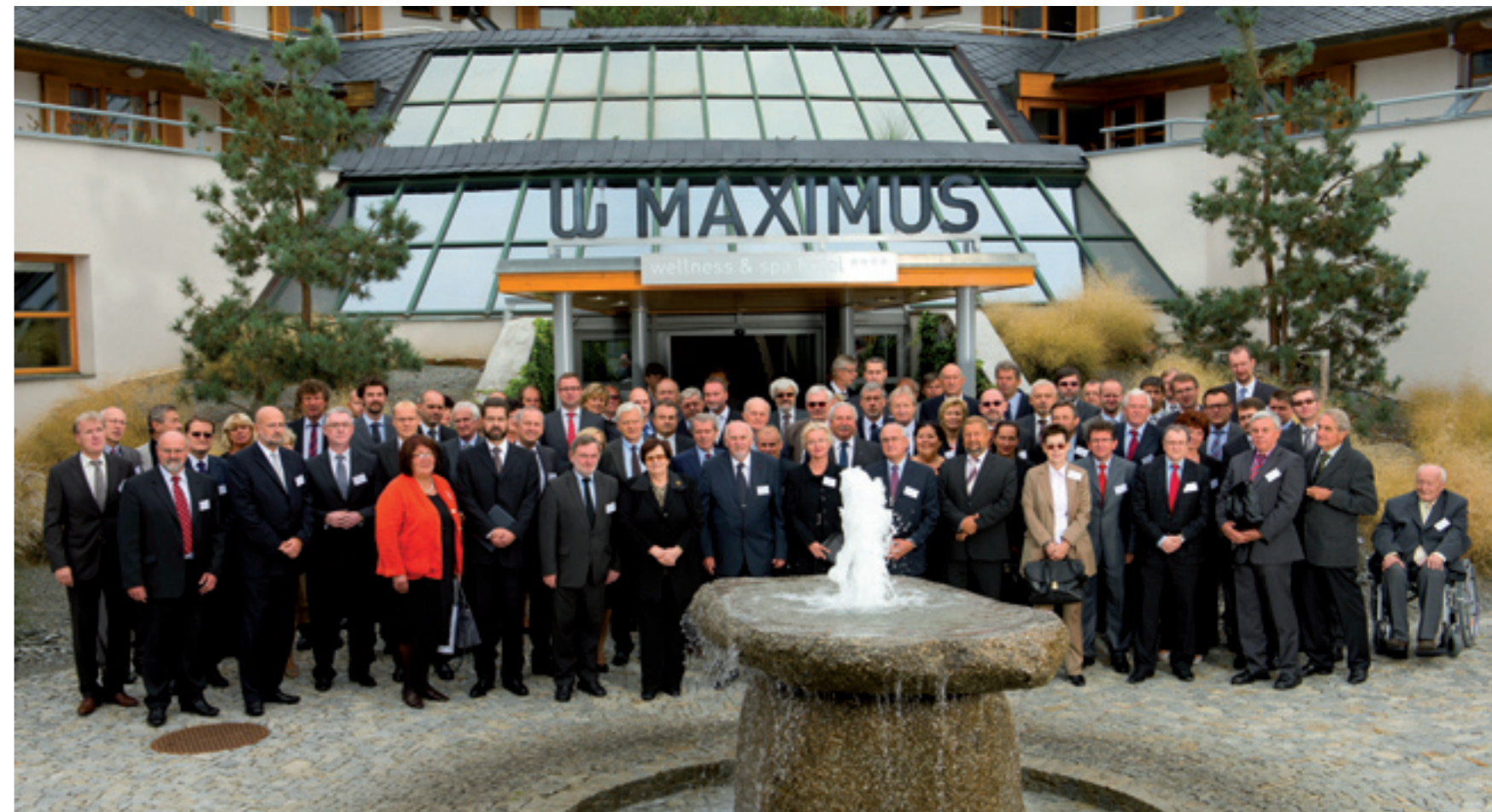
20. výročí založení Nejvyššího soudu v Brně, 10. 9. 2013