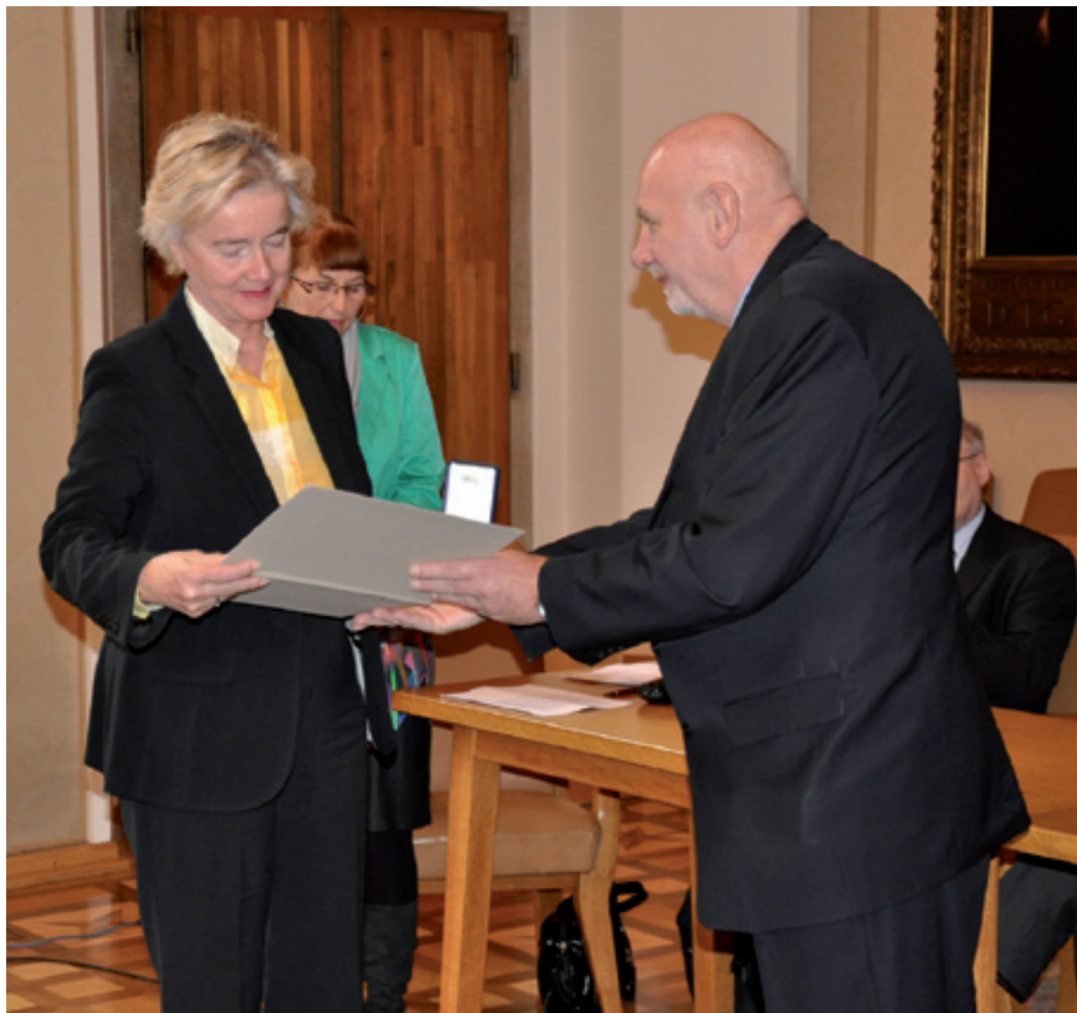
Udělení medaile Antonína Randy JUDr. Ivě Brožové, předsedkyni Nej- vyššího soudu, 4. 11. 2013