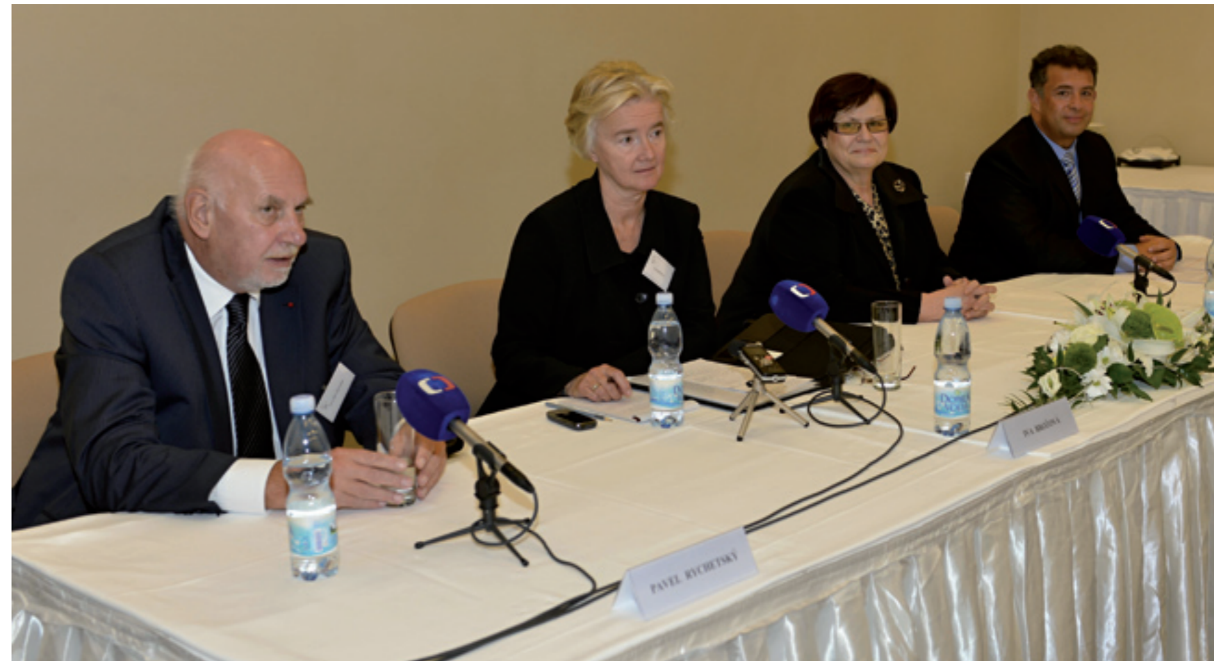
Tisková konference k 20. výročí založení Nejvyššího soudu v Brně, 10. 9. 2013