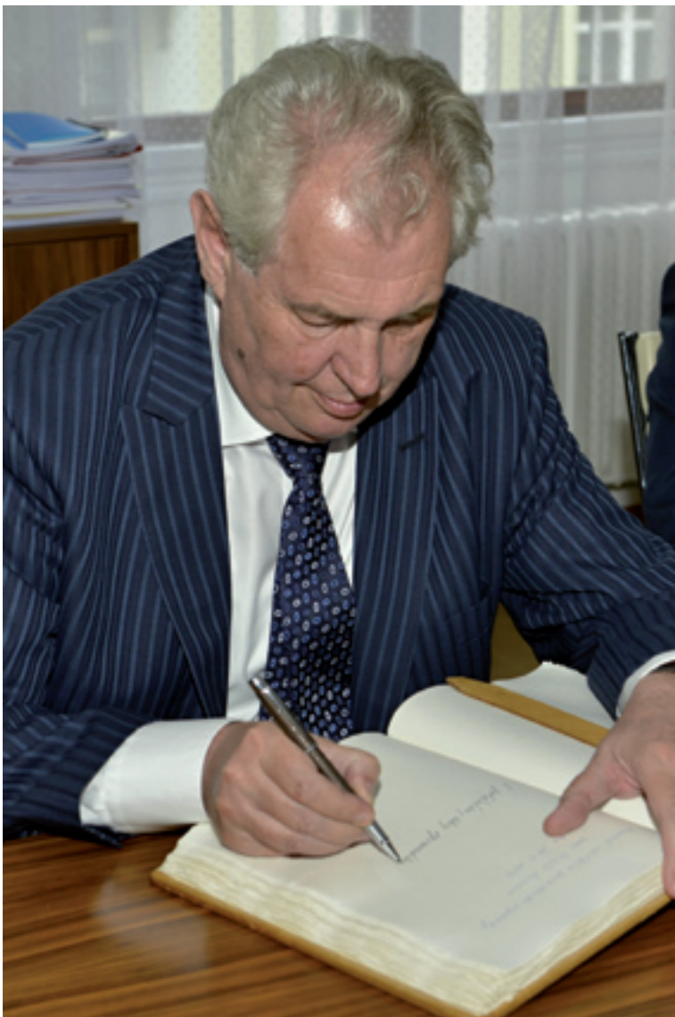
Návštěva prezidenta republiky pana Miloše Zemana u Nejvyššího soudu, 21. 5. 2013