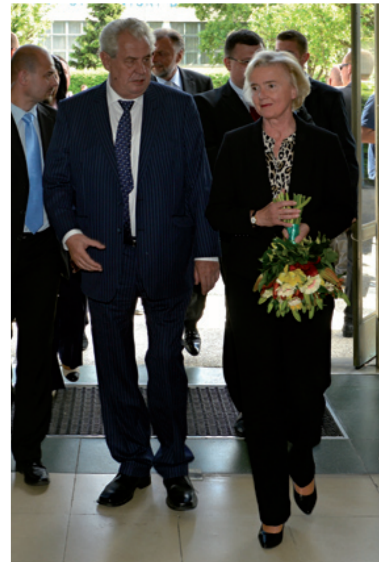
Návštěva prezidenta republiky pana Miloše Zemana u Nejvyššího soudu, 21. 5. 2013