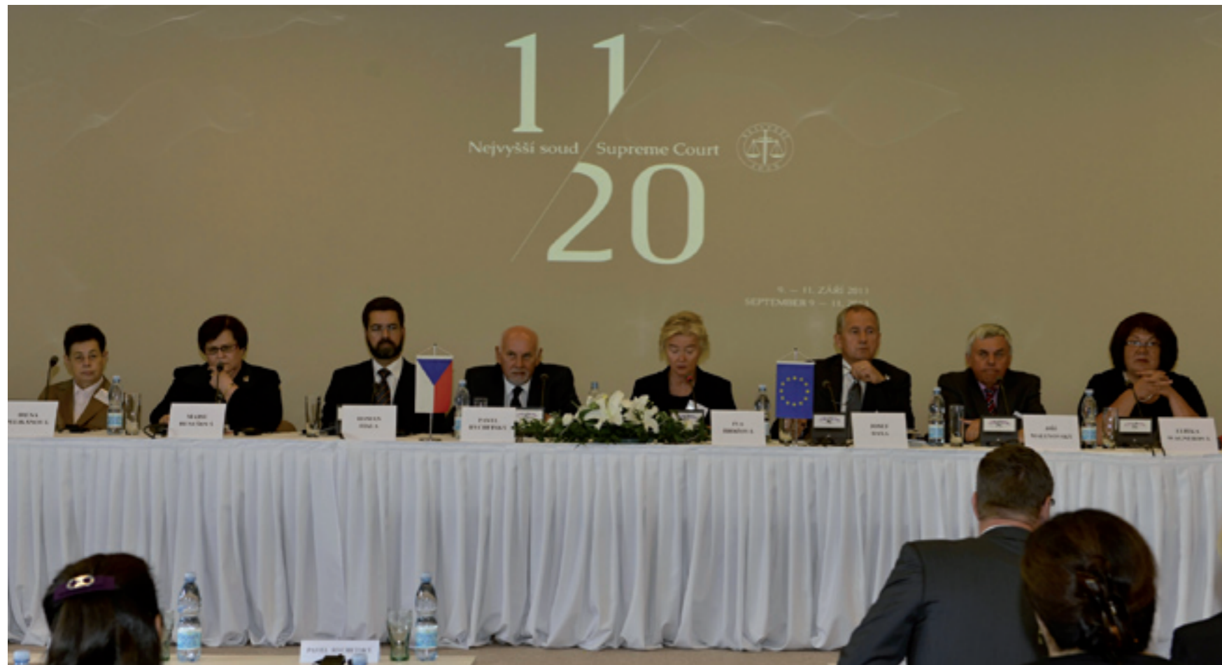
20. výročí založení Nejvyššího soudu v Brně, 10. 9. 2013